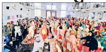
जीद। कार्यक्रम में शायत लेती आंगनबाड़ी कार्यकर्ता।