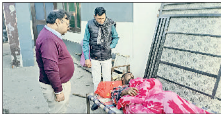
गुहला-चीका। गांव खुशहाल माजरा में स्वास्थ्य विभाग की टीम ग्रामीणों से बातचीत करते हुए तथा गांव खुशहाल माजरा में दूषित पेयजल की जांच करते अधिकारी

स्वास्थ्य विभाग की मेडिकल टीम ने गांव के प्रत्येक मोहल्ले में पहुंचकर लोगों की जांच की। कई ऐसे परिवार मिले, जिनके एक से अधिक सदस्य गंधीर बीमारियों से ग्रस्त हैं। ग्रामीणों ने बताया कि लंबे समय से बच्चों में कमजोरी, सांस संबंधी रोग, पेट की बीमारियां और त्वचा रोग बढ़ रहे हैं।