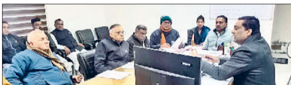
जीद। कार्यकारी अभियंता के साथ बैठक करते यूनियन नेता।