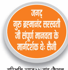
हरिभूमि न्यूज | डांड/कैथल