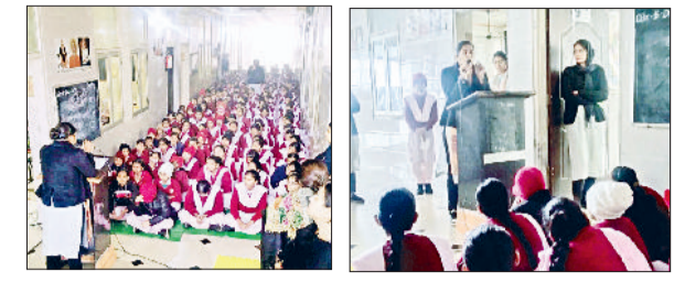
गुरुकुल में छात्राओं को स्वामी श्रद्धानंद के बलिदान से अवगत करवाते अध्यापिकाएं।