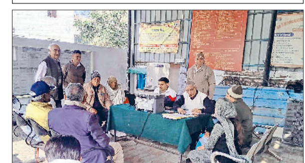
कैथल। शिविर में जांच करवाते पूर्व सैनिक।

वातावरण तो साफ होगा ही साथ ही पशुओं को नहाने और पीने के लिए पानी मिल सकेगा। तालाब की दशा सुधरने से सबसे अधिक फायदा भूजल स्तर को सुधारना है। साथ ही वातावरण में फैली गंदगी भी इससे साफ होगी। गांव के पशुओं को पीने के लिए साफ सुथरा पानी मिल सकेगा। तालाब के पानी से शाम सुबह को वातावरण ठंडा भी रहता है। हरियाणा राज्य तालाब प्राधिकरण एवं सिंचाई विभाग द्वारा तालाब की स्थिति को सुधारने के लिए कार्य शुरू किया गया है। तालाब की साफ सफाई होने से जल संरक्षण को बढ़ावा तो मिलेगा ही साथ ही ग्रामीणों को स्वच्छ वातावरण भी मिलेगा।