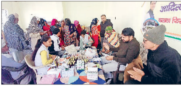
नरवाना। उपचार कराते हुए लोग।