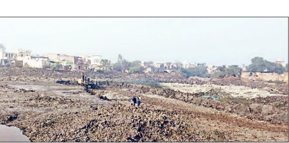
नगूरान गांव में तालाब के सौंदर्यीकरण को लेकर तालाब की खुदाई करती मशीन।