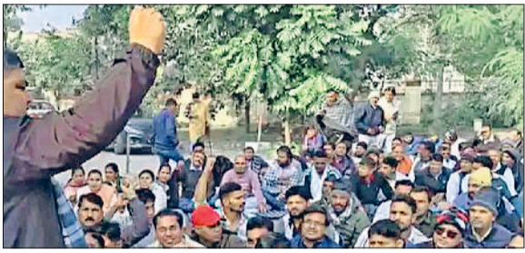
कैथल। राजीव गांधी विद्युत सदन में नारेबाजी करते कर्मचारी।

प्रदर्शन किए जा रहे हैं। उन्होंने कहा कि आदर्श ऑनलाइन पॉलिसी पर कर्मचारियों को आपत्तियों को गंभीरता से नहीं लिया गया तो आने वाले समय में यूनियन व संगठन और बड़ा आंदोलन करने को मजबूर हो जाएंगी। अगर यह ऑनलाइन पॉलिसी लागू होती है तो फाल्ट और दुर्घटनाओं की संभावना बढ़ जाएगी। जिसकी कीमत कर्मियों को जान देकर चुकानी