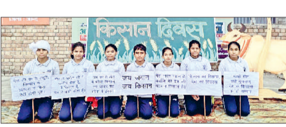
जीद। कार्यक्रम में भाग लेते हुए बच्चे।

आधारशिला स्कूल में किसान दिवस के अवसर पर कार्यक्रम का आयोजन किया। ये दिन पूर्व पीएम चौ. चरण सिंह की जयंती के रूप में मनाया जाता है। यह दिन किसानों के योगदान, संघर्ष और कृषि क्षेत्र के महत्व को सम्मान देने के साथ-साथ किसानों के कल्याण व जागरूकता बढ़ाने के लिए मनाया जाता है। इसमें बच्चों ने विभिन्न सांस्कृतिक गतिविधियों के माध्यम से किसानों के प्रति अपनी भावनाओं को व्यक्त किया। इनमें भाषण, गीत, कविता, स्कीट एवं नृत्य आदि रहे। नृत्य प्रस्तुति के माध्यम से बच्चों ने सभी को भाव विभोर कर